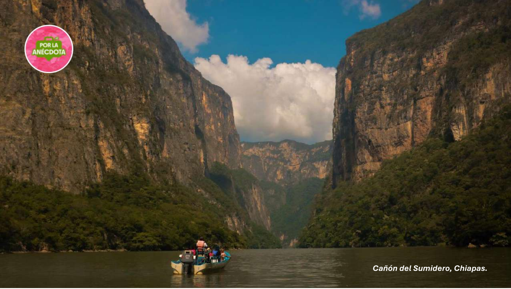
Cañón del Sumidero, Chiapas.